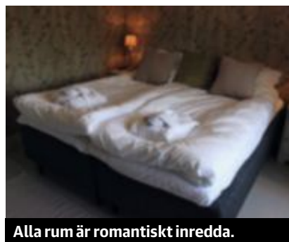
Alla rum är romantiskt inredda.