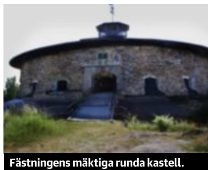
Fästningens mäktiga runda kastell.