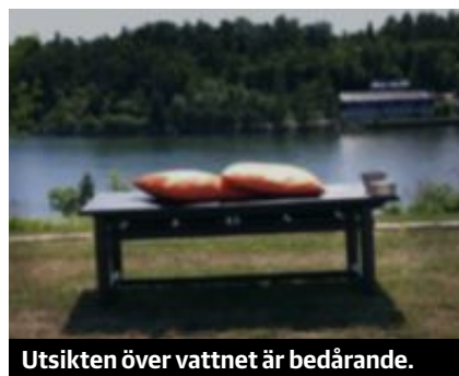
Utsikten över vattnet är bedårande.